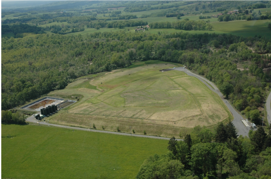
Vue aérienne du site de Rouzède